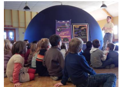
Cosmorium est une marque de la FRMJC Centre, déposée à l'INPI

Véritable salle de spectacle itinérante, le Cosmorium est un dôme gonflable itinérant qui utilise un système de projection numérique « pleine voûte » plaçant le spectateur au cœur de l'image.